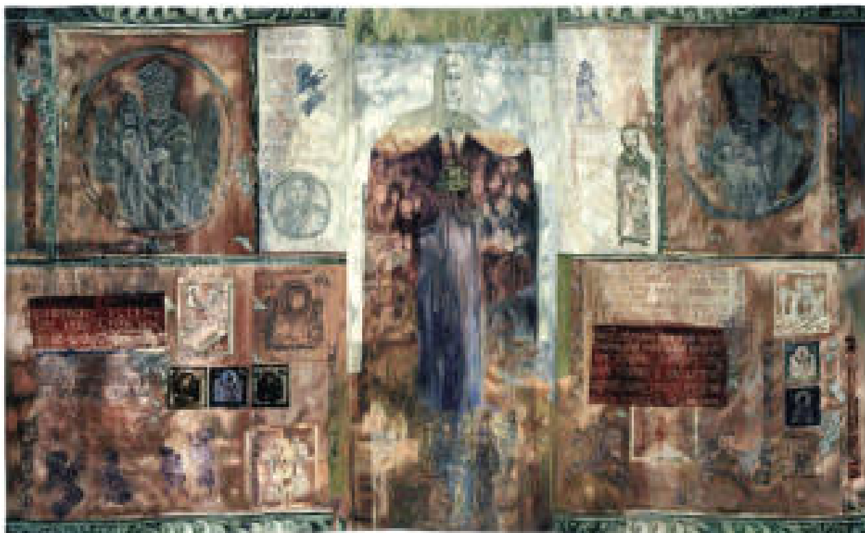
Szent István és műve | Saint Stephen and His Work, 1999-2000.

gyapjú, selyem, haute lisse | wool and silk, haute lisse