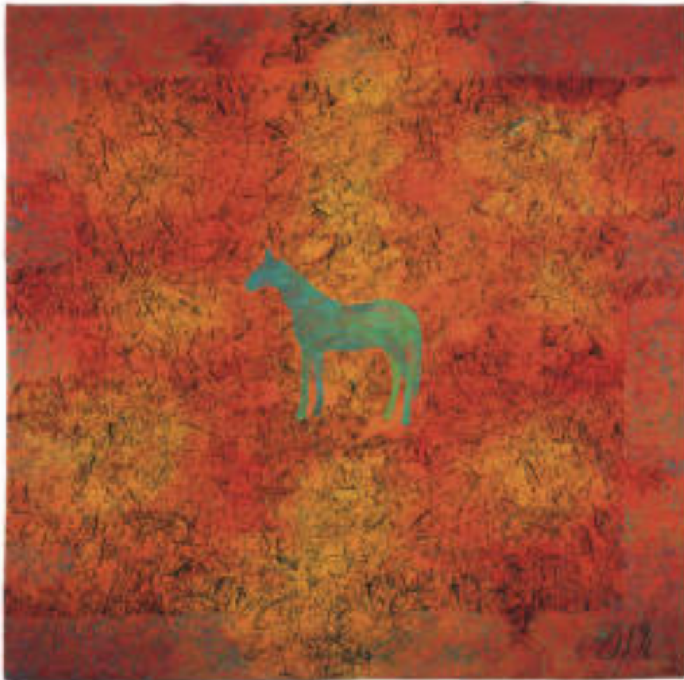
Nomád szőnyeg | Nomadic Rug, 1996 gyapjú, selyem, haute lisse | wool and silk, haute lisse