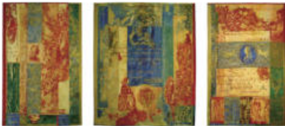
Corvin kárpitok | The Corvinus Tapestries, 2003-2006