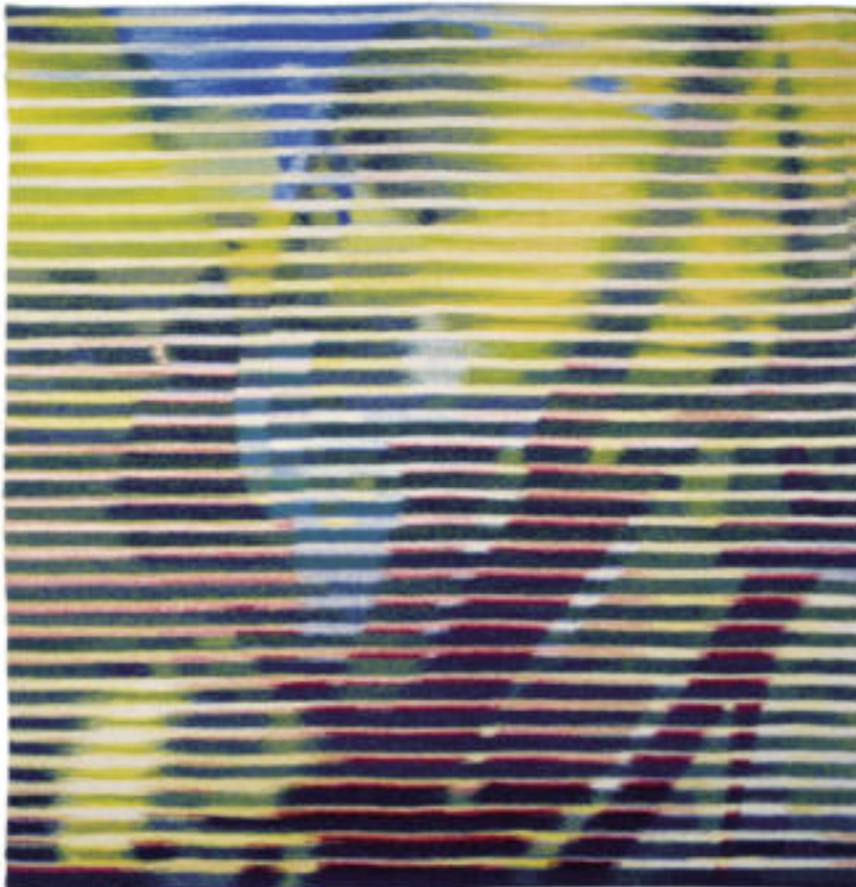
Részlet a Részlet I.-ből | Detail of Detail I, 1986 gyapjú haute lisse | wool, haute lisse