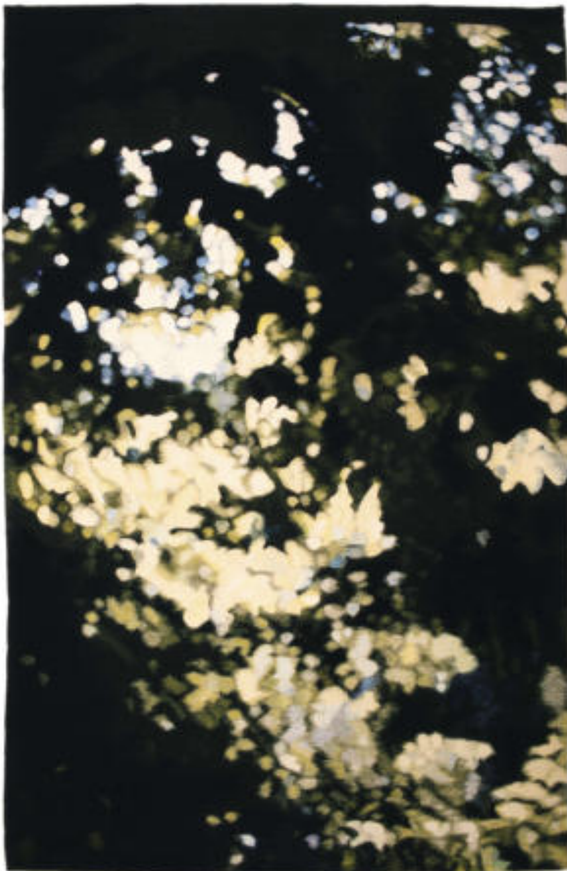
Részlet IV zöld | Detail IV green , 1987 gyapjú, haute lisse | wool, haute lisse