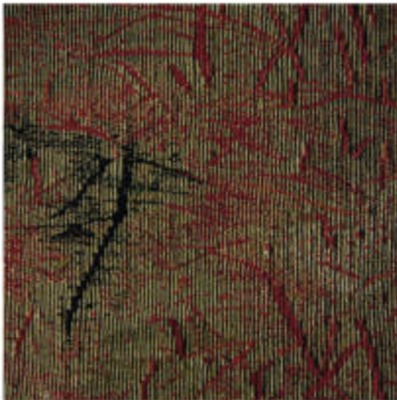
Fű III. (6 részes sorozat) | Grass III. (6 piece series), 1995 gyapjú, selyem, plexi | wool , silk and fibreglass