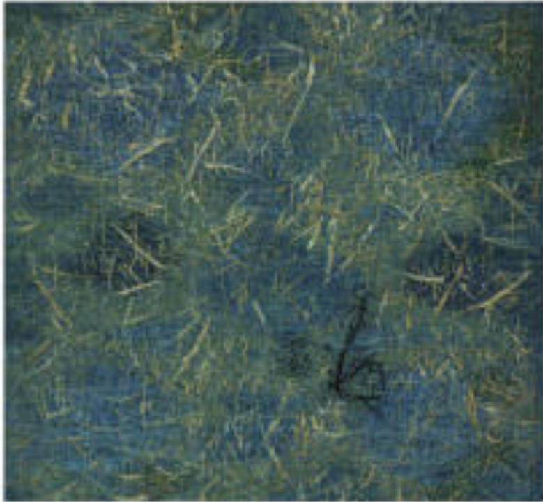
Fű III. (6 részű sorozat) | Grass III. (6 piece series), 1995 gyapjú, selyem, plexi | wool , silk and fibreglass