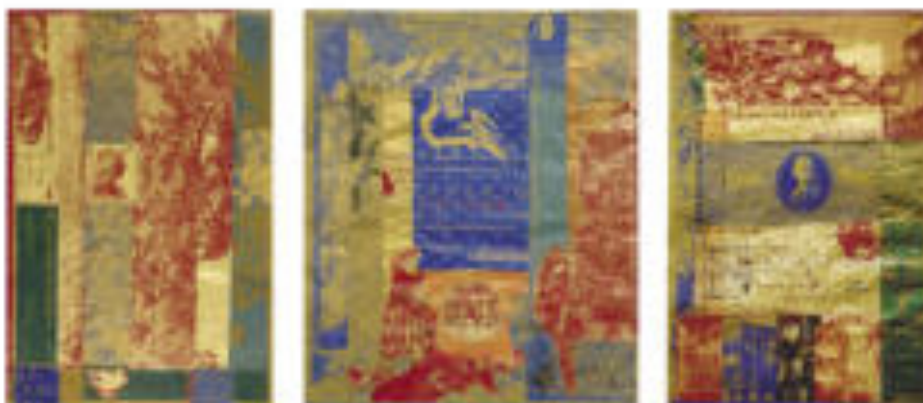
Corvin kárpitok | The Corvinus Tapestries, 2003-2006