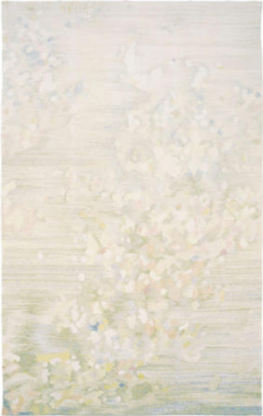
Lomb részlet | Detail of Foliage, 1988 gyapjú, haute lisse | wool, haute lisse