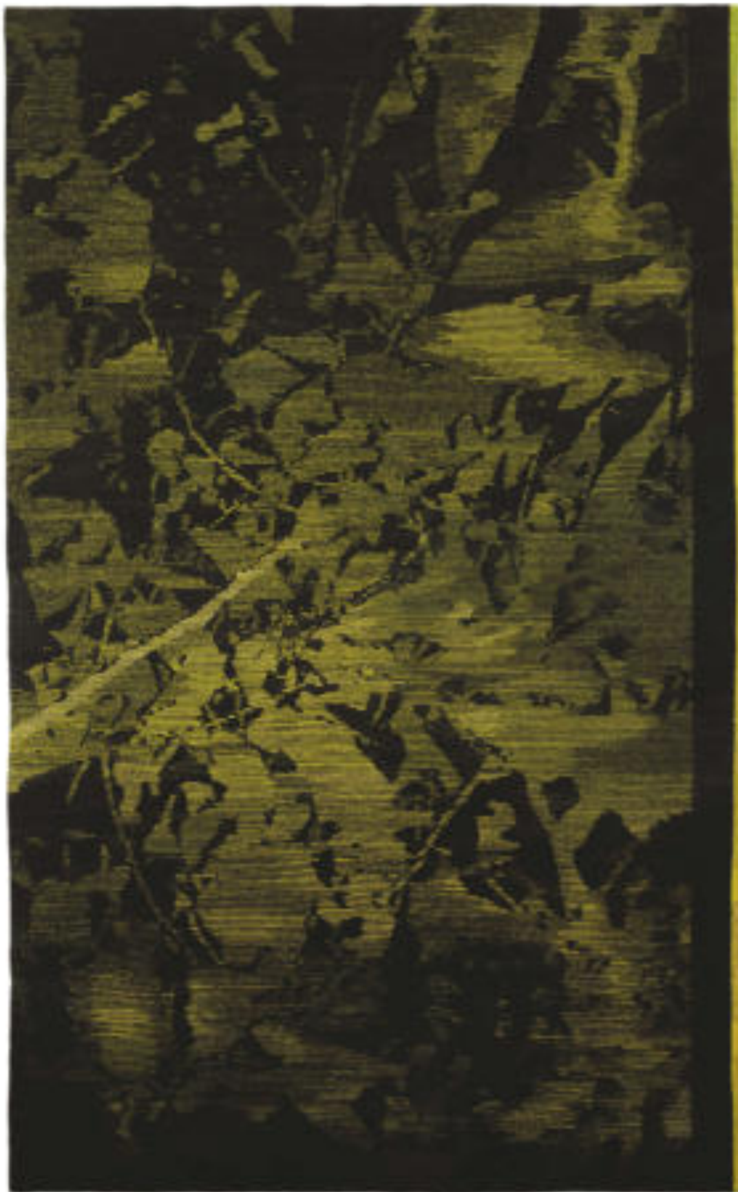
Mindörökké | Forever, 2001 gyapjú, selyem, haute lisse | wool and silk, haute lisse