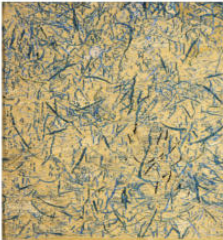
Fű III. (6 részű sorozat) | Grass III. (6 piece series), 1995 gyapjú, selyem, plexi | wool , silk and fibreglass