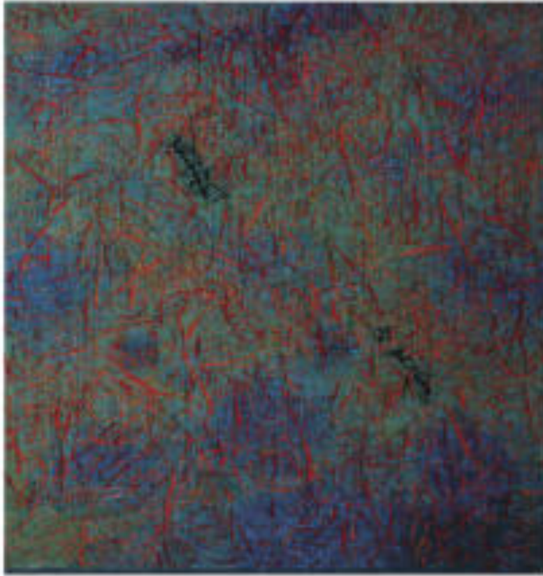
Fű III. (6 részes sorozat) | Grass III. (6 piece series), 1995 gyapjú, selyem, plexi | wool , silk and fibreglass