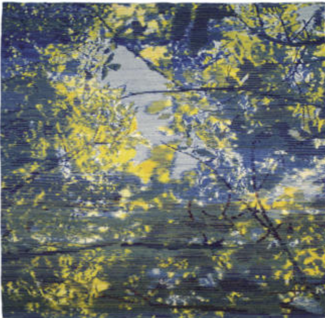
Részlet I. | Detail I., 1977